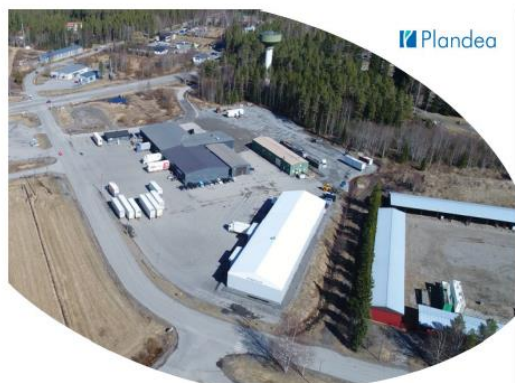
Kannuksen kaupunki Keskustan asemakaavan muutos Raonhaan ja Ojuankankaan alueella